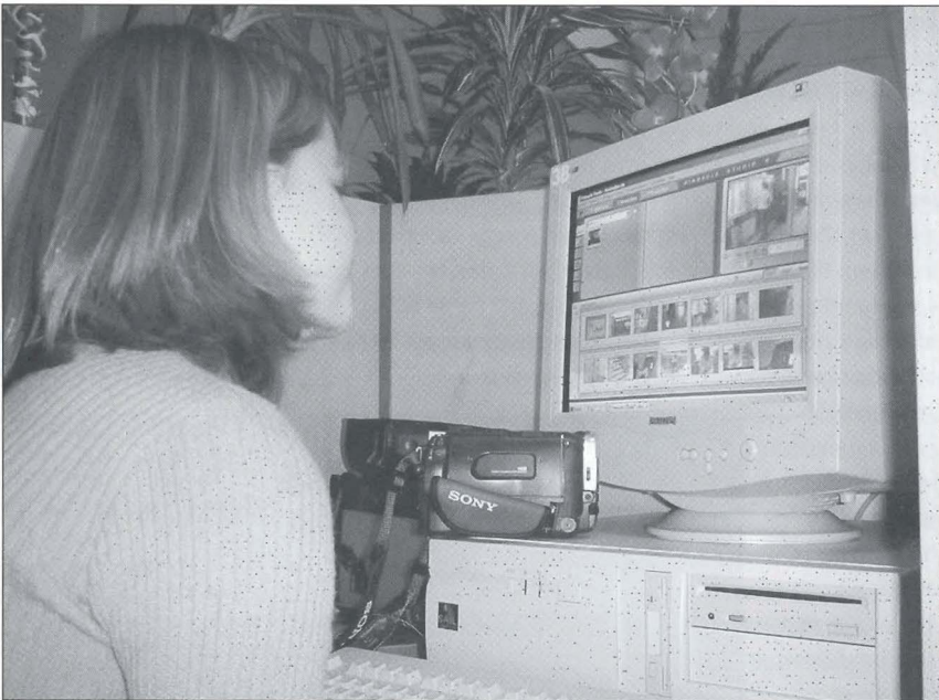
Montage van een korte videoproductie.

In het ideale geval had de school elke leerling