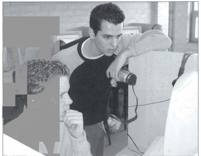
Webmaster uit 6 vwo controleert een site in aanbouw.

wordt en de gastdocenten en de media-consulent van EDU-ART steeds meer op de achtergrond raken. Daarom heeft de school ook twee eigen docenten met het project mee laten doen in het programma voor de leerlingen.: We noemden hen eio's: experts-in-opleiding. Zij werden op dezelfde wijze vrijgemaakt als de leerlingen en hebben het project van binnenuit gevolgd. Zij zullen volgend schooljaar ook deel uitmaken van de projectgroep Nieuwe Media die het vervolg voorbereidt. EDU-ART kon niet voorzien in een gastdocent webbouw die met de leerlingen de site zou gaan bouwen. De school heeft die zelf gevonden. Na eerst in gesprek te zijn geweest met webbouwers van de plaatselijke universiteit kwamen de projectleiders er achter dat in 6 vwo een leerling zat die inmiddels zijn eigen bedrijf had in onder andere het bouwen van sites. Deze leerling heeft met enorm veel inzet de leerlingen tijdens het project begeleid en is ook het aanspreekpunt geweest tussen de projectgroep en de ICT-afdeling van de school. Zijn docenten zijn met grote flexibiliteit omgegaan met de onregelmatige lesgang van deze leerling en hij heeft met een groot gevoel van verantwoordelijkheid op een goede manier geschakeld tussen project en school. De docent aardrijkskunde, die een eigen reclamebedrijf heeft, nam samen met hem het onderdeel webdesign voor zijn rekening.